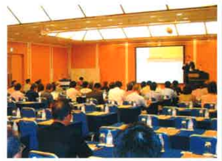
以前のセミナーの様子